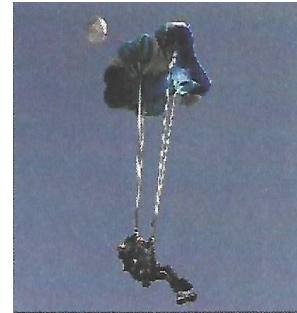
c – ouverture du parachute

Préciser si chaque affirmation est vraie ou fausse.