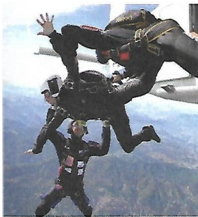
a – Saut de l'avion

Un photographe a sauté au même instant que le parachutiste photographié. Il a classé chronologiquement les photos de gauche à droite.