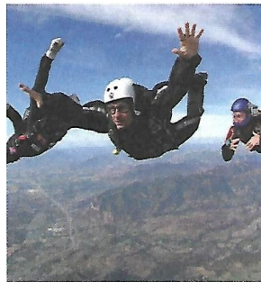
b – chute libre